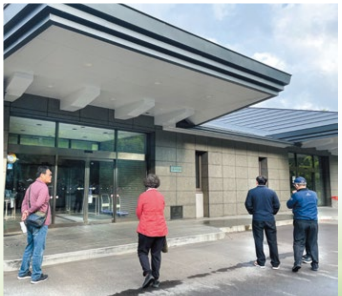
(東山墓園教會信徒合葬之墓)

函館市營的東山墓園也有清楚的告示牌。讓我們眼睛一亮起來的是發現了一座教會信徒合葬之墓，在以家族墓羅列之區域，顯得引人注目。讓同工們也在思考，平安園日後的規劃，是否也可以教會為單位來處理。