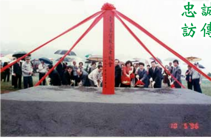
平安園1996年5月10日動土典禮