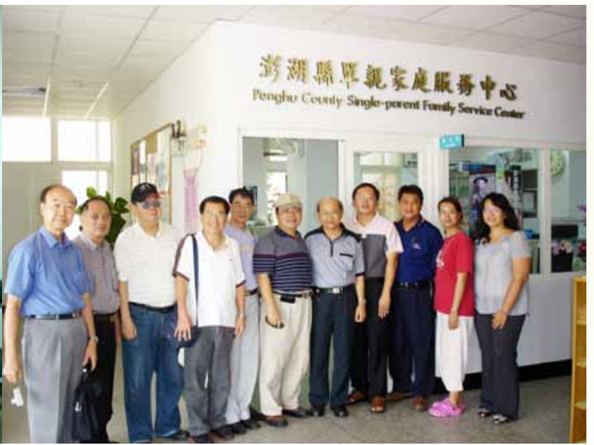
平安園委員前往澎湖造林考察

以公事公辦，尋求事業最有利的角度。因為基督教平安園是很重要的福音事業，我們要超越個人的喜好來做決策。