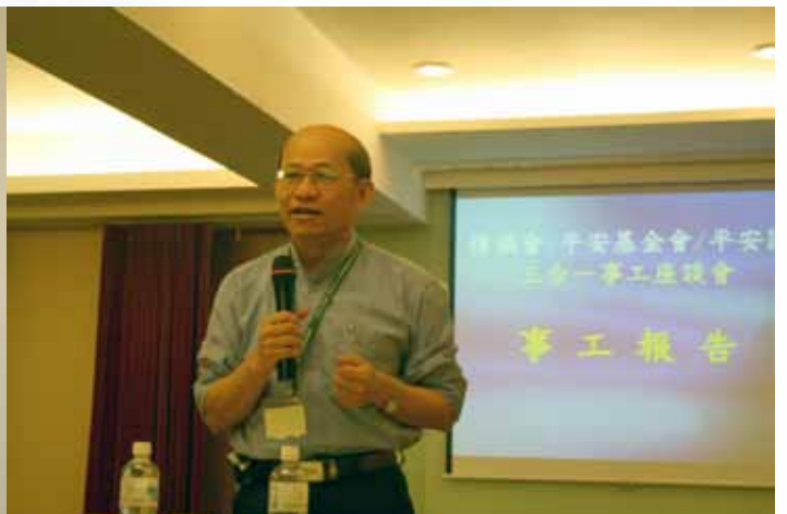
傳福會/平安基金會/平安園 三合一事工座談會