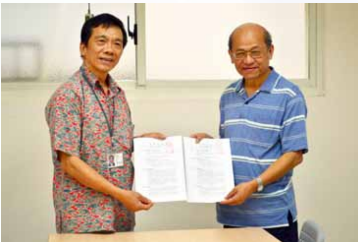
向芥菜種購買澎宣土地

就是牧師同工們，年資雖然滿25年可退休，但是中間若有因故退任，則要按比例扣除安養金，這個部份，我覺得有失苛刻。因為同工中間有空置年資，是因為沒有服事的機會，是沒機會做，不是不願意做，找不到合適的職場，不但年資減少、當時生活有問題、還要將來被比例扣除安養金，實在不近人情。這是牧會順利的同工不能體會的。我建議，只要總年資夠了(目前是25年)，不要計較中間退任的時間。畢竟職場的銜接，不是我們完全能操控的。