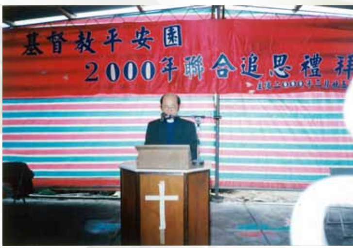
平安園2000年聯合追思禮拜